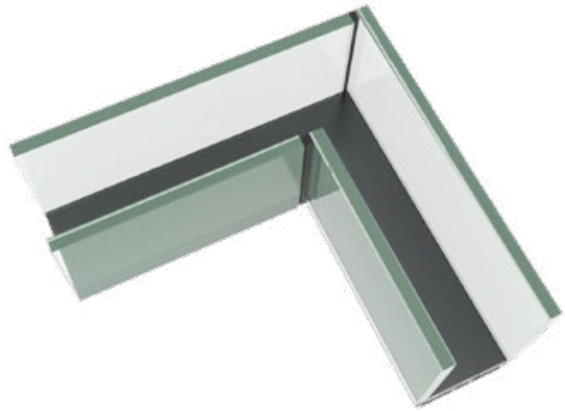
| Offene Glaseckverbindung