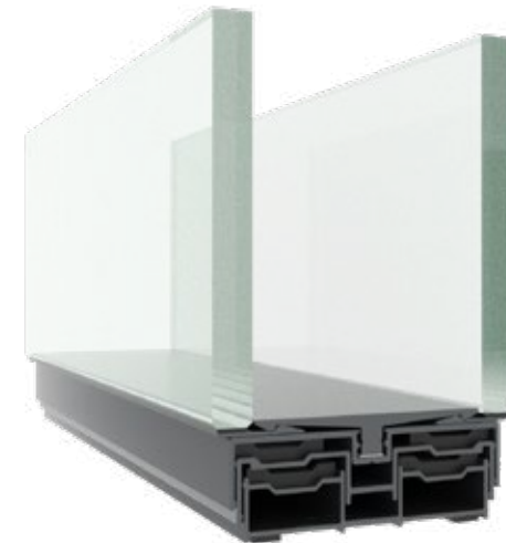
| Teleskopisches Bodenprofil