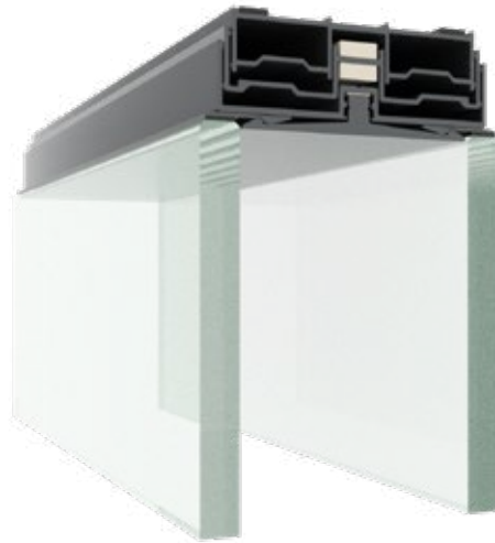
| Teleskopisches Deckenprofil